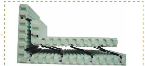
מבט על רשת מתקפלת בעלת צירים מתכתיים, ורשת תוסף לפינות זוויתיות (בכללת בהזמנה).