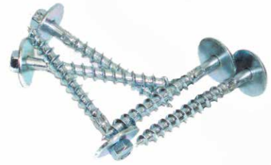
ייתכן שהמוצר בפועל יהיה שונה מהמוצג כאן המוצר כפוף לשינויים

ניתן להשתמש בבורג מס' 10 לחיבור מערכת היישור של NUDURA אל התבניות. שימושים נוספים כוללים חיבור פסי חיבור או משקופים עוררים לבטון. זמין בגדלים 2 אינץ' (50 מ"מ), 2.5 אינץ' (64 מ"מ) ו-3 אינץ' (76 מ"מ). בכל חבילה נכללים שני מפתחות ¼ אינץ' (6 מ"מ).